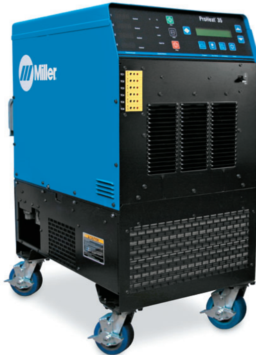
Источник питания ProHeat 35 (907690), показан с индукционным охладителем большой мощности (301298) и дополнительным шасси (195436).