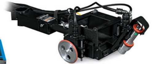
Передвижной индуктор, показан с дополнительным монтажным коленом (301119), системой фиксации движения (301183) и инфракрасным температурным датчиком (301149).