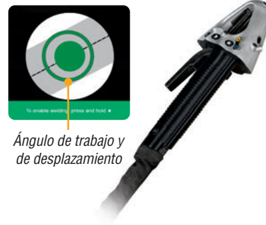
Ángulo de trabajo y de desplazamiento

SmartGun es una antorcha MIG de 400 A exclusiva en la industria apta para guantes con LED incorporados que son seguidos por las cámaras del sistema. El mango ergonómico de agarre blando ofrece retroalimentación de vibración táctil que ayuda a guiar los ajustes de rendimiento en tiempo real; esto refuerza la posición óptima y el movimiento. La pantalla OLED de SmartGun ofrece una retroalimentación visual inicial para guiar el posicionamiento de la antorcha. Los botones constituyen una alternativa de navegación, en lugar de utilizar la pantalla táctil.