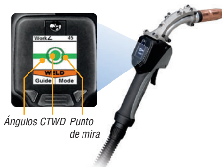
Ángulos CTWD Punto de mira

La base de ArcStation™ está equipada con una mesa con tablero reversible de acero de 1/2 pulg., completa con cajones, soporte para antorcha, pinzas de liberación rápida y ruedas orientables reforzadas.